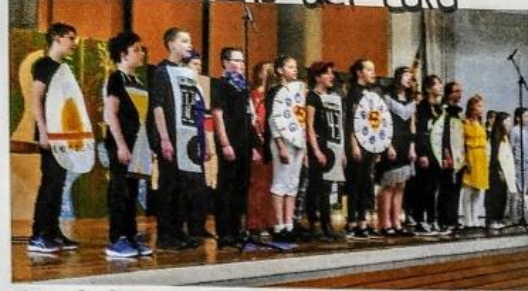
Il spettacolo del coro

Ecco il famoso coro del liceo Quenstedt. Eseguono il musical "Auszeit - die Stunde der Uhren" è molto interessante.