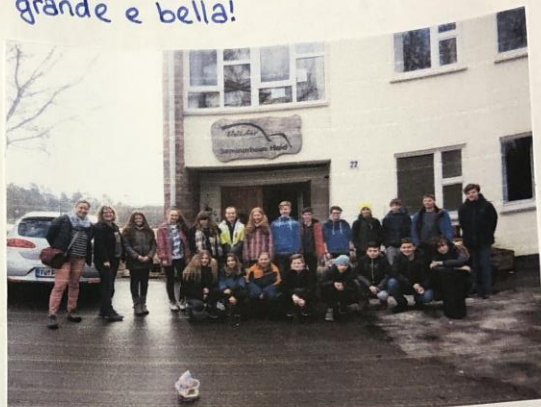
C'è un campo scuola ogni anno per le Settime classe.