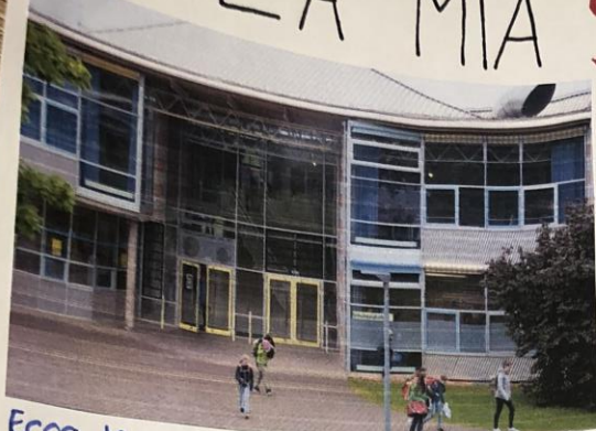
Ecco la mia scuola! Si chiama "Quenstedt Gymnasium" (liceo).