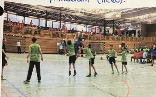
da mia scuola è molto sportiva. Ci sono eventi sportivi ogni anno. Per esempio tornei di pallamano o di calcio!