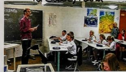
la classe / l'aula

La sesta classe durante di lezione di geografia. Parlano inglese perché è all-English-day.