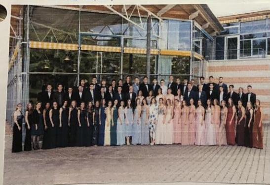
da mia scuola fa un ballo di fine anno ogni anno. È bellissimo! Non vedo l'ora che arrivi il mio!